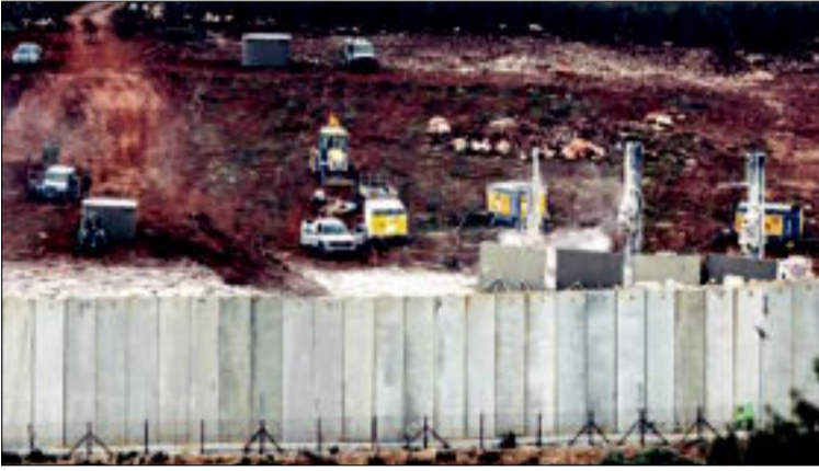
آليات إسرائيلية تستكشف أنفاق «حزب الله»

«حزب الله» بناها وهيأها للحرب المقبلة. وقد قوبل هذا الإجراء باستنفار «حزب الله» لقواته بشكل مرئي للقوات الإسرائيلية في رسالة واضحة بأنه على استعداد في حال تدرجحت الأمور نحو الأسوأ.