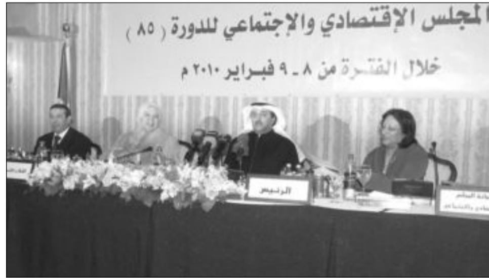
جانب من الوفود المشاركة