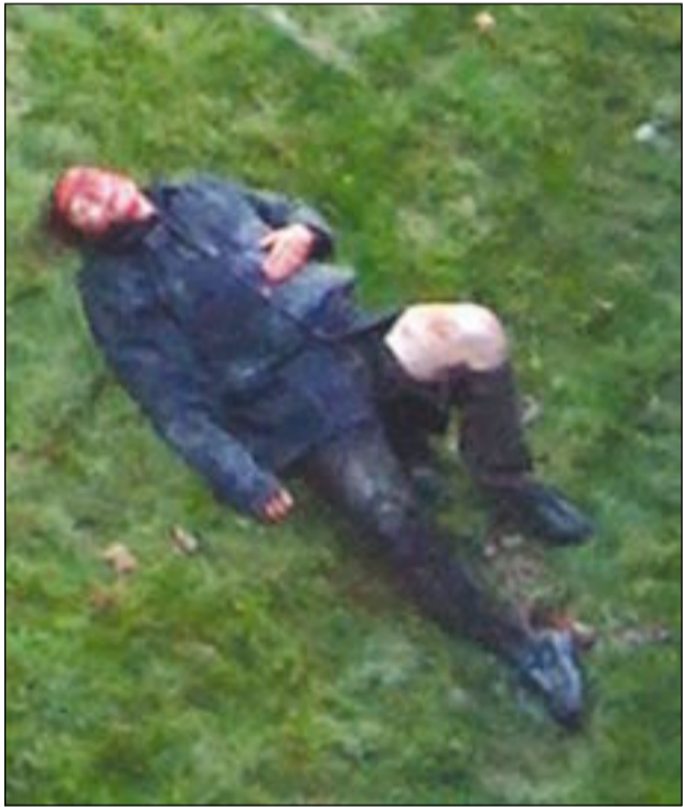
المختل بعد تحرره من أنياب الدب

كان المشهد مروعا في حديقة حيوان بمدينة بيرن السويسرية عندما سقط احد زوارها في حظيرة مخصصة للدببة فهاجمه دب شرس وكاد ان يمزقه اربعا بعد ان التقطه بين انيابه. وفي تفاصيل الواقعة التي حصلت اول من امس ان احد زوار حديقة غافل الحراس وتسلق الى اعلى سور حظيرة مفتوحة مخصصة للدببة وظل جالسا فوق السور لمدة 10 دقائق بينما سارع مسؤولو الحديقة الى استدعاء الشرطة. وقبل وصول الشرطة بدقة واحدة تعالت صرخات زوار الحديقة عندما قفز الرجل في داخل حظيرة الدببة فهاجمه دب ضخم والتقطه بين فكيه وكأنه دمينة محاولا تمزيقه باننيابه الحادة. بينما راح عدد من زوار الحديقة يلتقطون الصور لذلك المشهد. لحسن الحظ فإن رجال الشرطة وصلوا في الوقت المناسب حيث سارعوا الى اطلاق النار في الهواء لكن الدب لم يتراجع بل حاول ان يستمر في اقتراس ضحيته فما كان من رجال