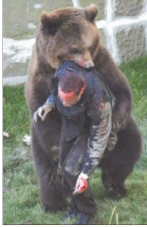
وملجأ به مثل دمينة