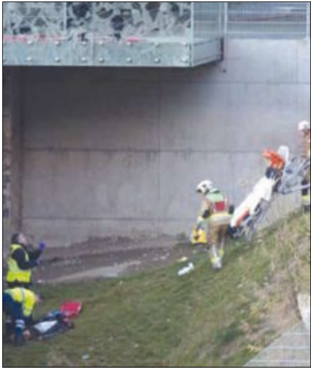
رجال الاسعاف ينقلون المختل إلى المستشفى