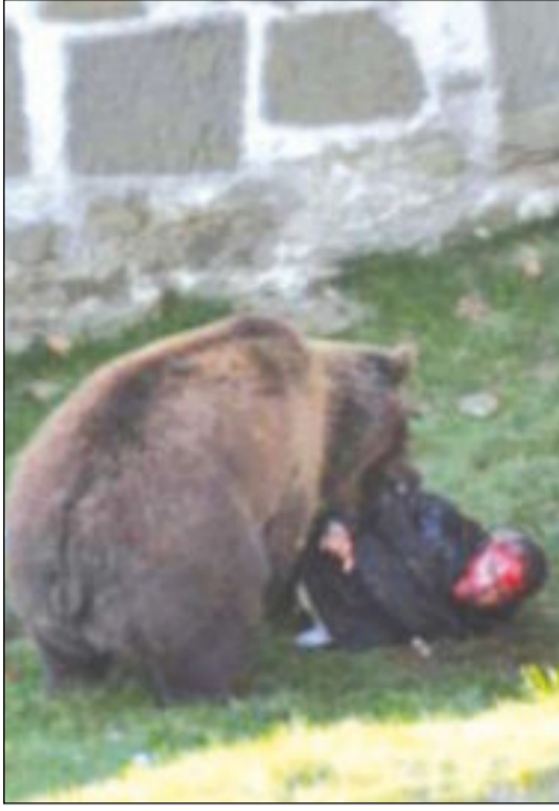
الدب منقضا على الزائر لحظيرته