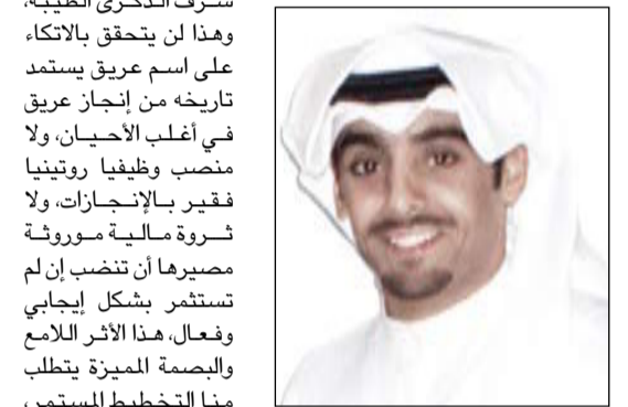
بقلم ضاري الزوان *

وستحاول يوماً أن تثبت بأن الطريق المعبود اليوم لم يكن كذلك بالأمس، وبفضل الجهد والعمل والإيمان بالمقدرة نستطيع التغلب على الصعاب ونبرهن لذاتنا أن النجاح والفشل حليفين دائمين فالوثية الثابتة لا بد لها من خلوتين صغيرتين للوراء، وسيفي السؤال يطرح في كل رحلة وإشراقة جديدة من أنا؟ هل توجت حياتي بإنجاز مميز مهما كان بسيطاً ومتواضعاً ويستحق شرف الخلود؟ ونسأل أنفسنا هل فشلت؟