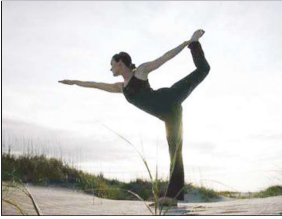
احدى حركات اليوغا