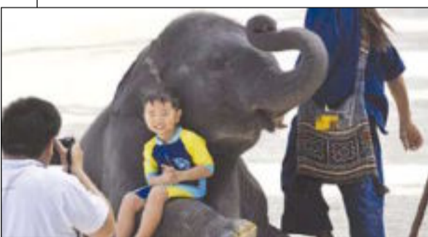
... وترحب بالتقاط الصور مع الصغار

وضع له اطباء مادة كاوية «اليزول» إلا أنها أصابت الرضيع بفرغرينا في الغضيب لمدة 72 ساعة وهو ما أدى إلى سقوط العضو. وفي الحالة الثانية، تسببت غير زوجة الأب في تشويه مجرى بول طفل 4 سنوات، وإجراء جراحة له. وكانت زوجة الأب - التي لا تتحجب - قامت بإحاطة قصب طفل ضرتها بـ «شعر حسان» بدافع الغيرة، وهي عادة معروفة في الأوساط الشعبية تستخدم عند الانتقام، وفي هذه الحالة يعتاد الطفل الأمل ولا يشعر بوجود شعر الحسان. أدى ذلك إلى قطع مجرى البول للطفل، ما اضطر فريق طبي في أحد مستشفيات الإسكندرية أيضا إلى عمل مجرى بول جديد له بدلا عن المجرى المصاب، وذلك لفترة مؤقتة لحين شفاء المجرى الطبيعي.