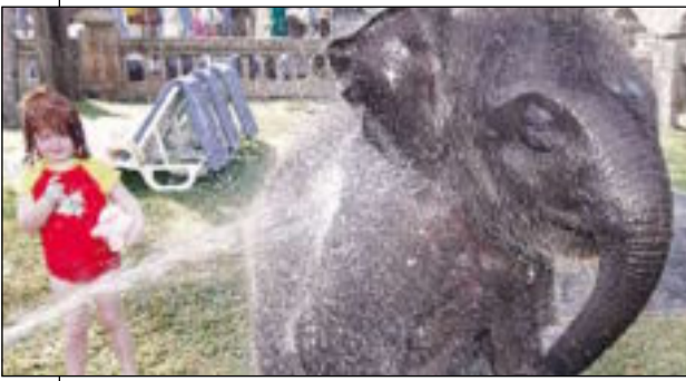
حان وقت استحمام «ميناء»